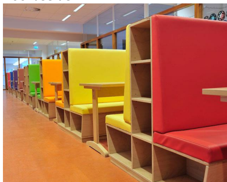
Treinzitjes (3 stuks)